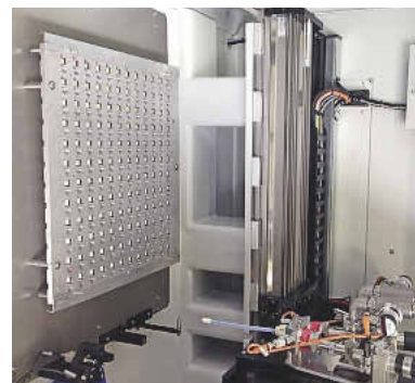
Es befinden sich 3 Anlagen nebeneinander vor Ort in Tunis.